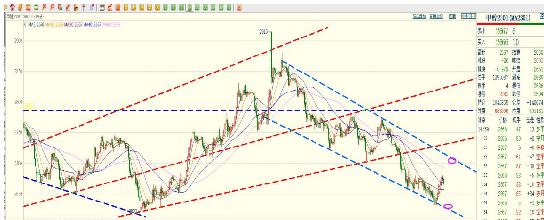
图：甲醇 2301（15 分钟 K 线）

甲醇早间沿着 15 分钟趋势线运行，午后依托反弹，但目前仅能视为调整过程中的修正，尚不能确认调整结束。