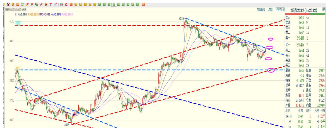
图：沥青 2212（15 分钟 K 线）

布伦特原油围绕 92 美元整固，下方整数关口未击穿之前，上行趋势仍未完全破坏，但基本面、宏观面无持续性上行的内在驱动。