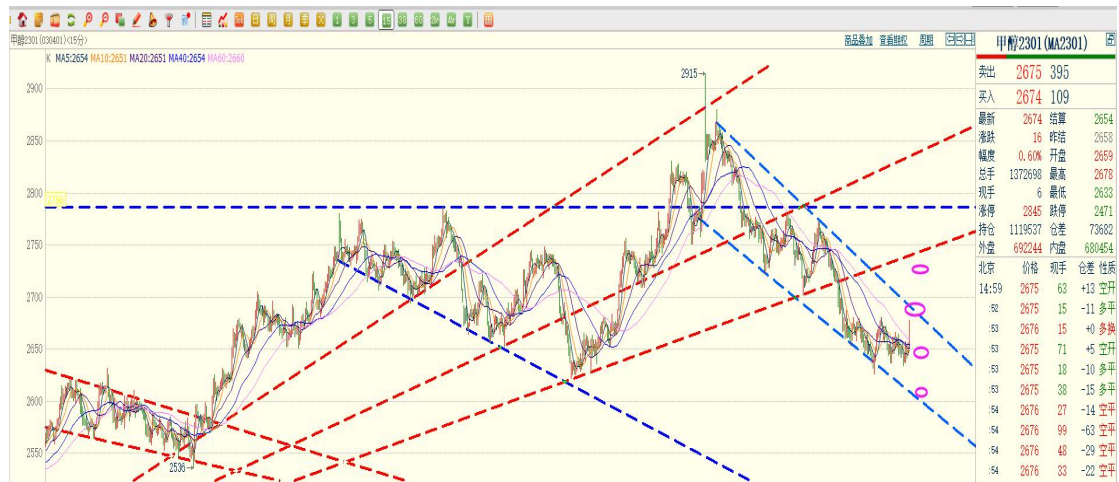
图：甲醇 2301（15 分钟 K 线）

甲醇符合不追空的预期，日内通道内横盘，15 分钟表现出意图向上测试上沿的迹象，晚间参考通道阻力的表现，作为进步强弱依据。