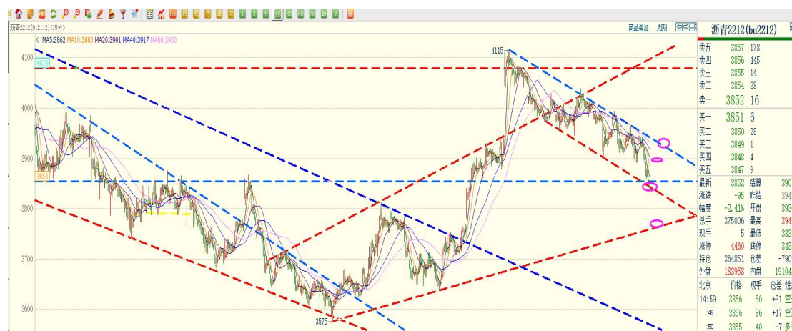
图：沥青 2212（15 分钟 K 线）

布伦特原油日内弱势横盘，目前整数关口一带的支撑仍在确认中，可作为进步多空分水岭。沥青符合高空思路，日内逐步走低，收跌超 2.4%。技术上看 15 分钟调整通道下沿若击穿则进步空间打开。晚间参考第一支撑的表现，作为进步强弱依据。